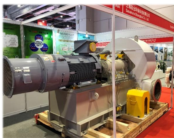
ヒートポンプ(コンプレッサー)実機